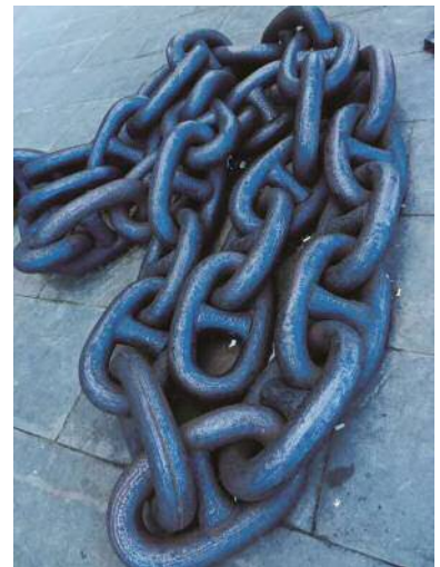
森山大道《記録 No.23》2012年 作家蔵