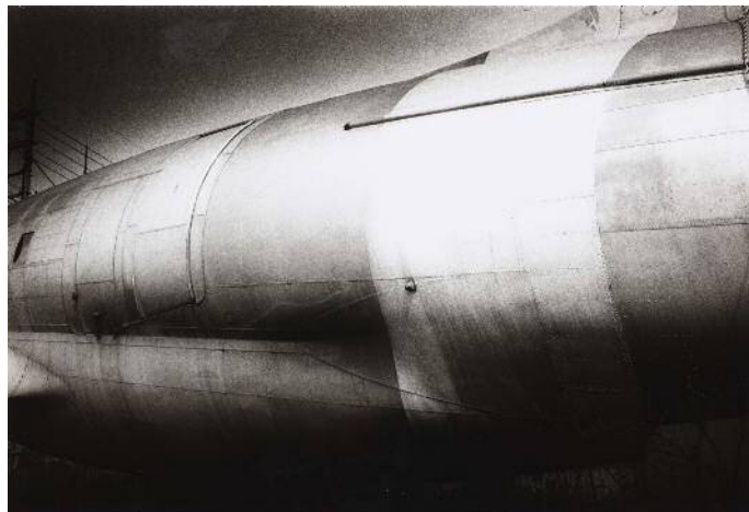
森山大道《犬の記憶》1982 年