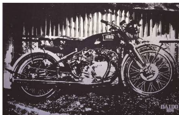
森山大道《ヴィンセント・ブラックシャドウ》1974年

島根県立美術館蔵