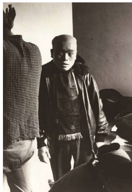
森山大道《にっぽん劇場》1967年