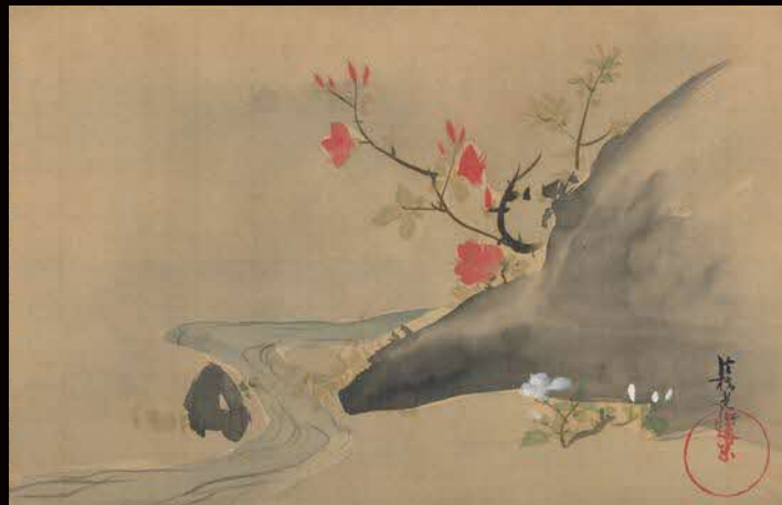
重要文化財 躑躅図 尾形光琳筆 江戸時代【前期展示】