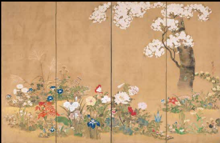
四季花木図屏風 酒井抱一筆 江戸時代【前期展示】