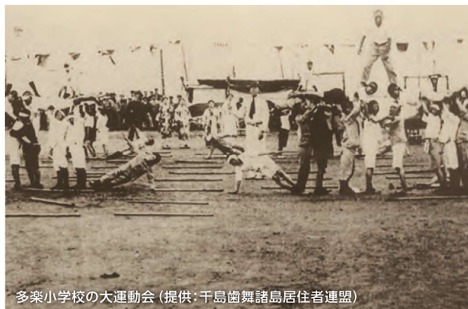
多楽小学校の大運動会