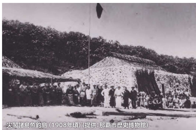
尖閣諸島魚釣島 (1908年頃)