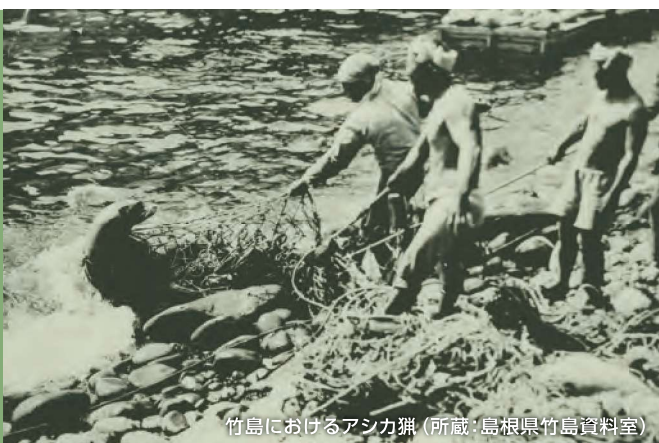
竹島におけるアシカ猟