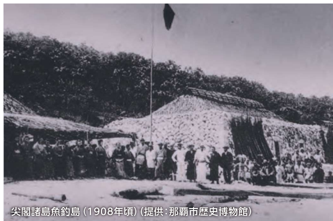
尖閣諸島魚釣島 (1908年頃)