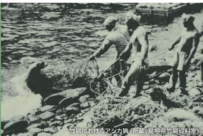
竹島におけるアシカ猟