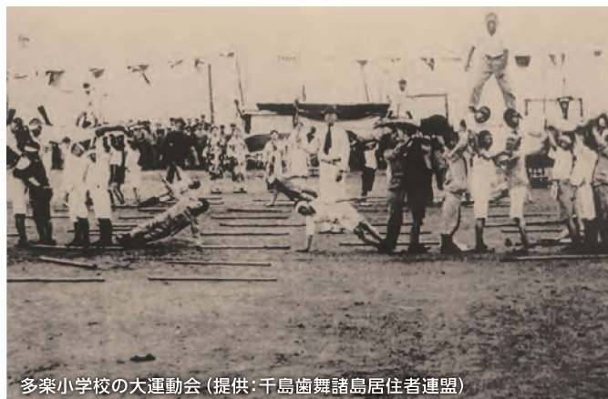
多楽小学校の大運動会