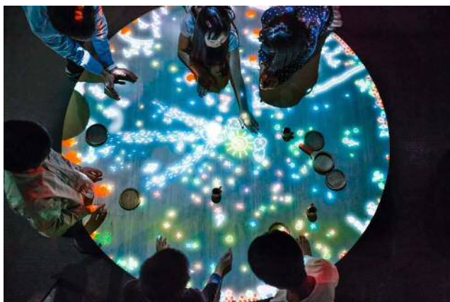
《小人が住まうテーブル》 ©チームラボ