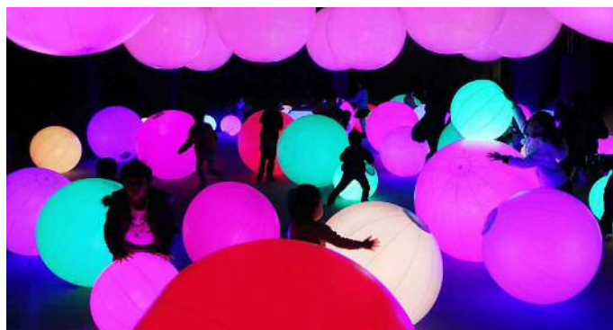
《光のボールでオーケストラ》 ©チームラボ