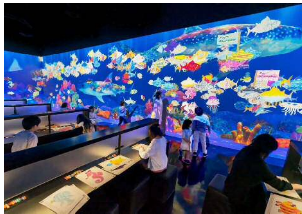
《世界とつながったお絵かき水族館》©チームラボ

「チームラボ 学ぶ！未来の遊園地」は、共創（共同的な創造性）のための教育的なプロジェクトであり、実験的な場です。子どもから大人まで楽しめる展覧会で、これまで、シドニー、バンコク、北京、上海、ジャカルタ、ヨハネスブルグ他、各地で開催され、常設展もお台場、シンガポール、ドバイ等、各地で展開中。