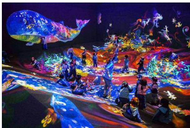
《グラフィティネイチャー - 山と谷、レッドリスト》