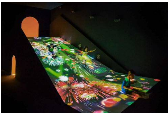
《すべって育てる！フルーツ畑》©チームラボ