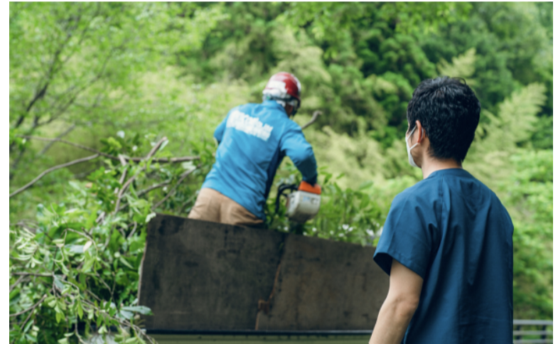
【林業における伐採場面の分析】

今回の受賞をきっかけに多くの反響を全国からいただいております。この島根から全国に発信する新たな「健康経営実践」のあり方、ぜひご注目ください！！