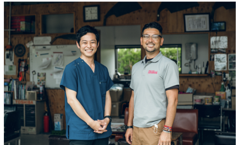
【藤井共同代表（Canvas）と大高社長（きこり）】