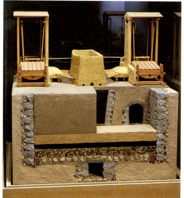
(左) 近世たたらの地下構造 (右) 地下構造模型