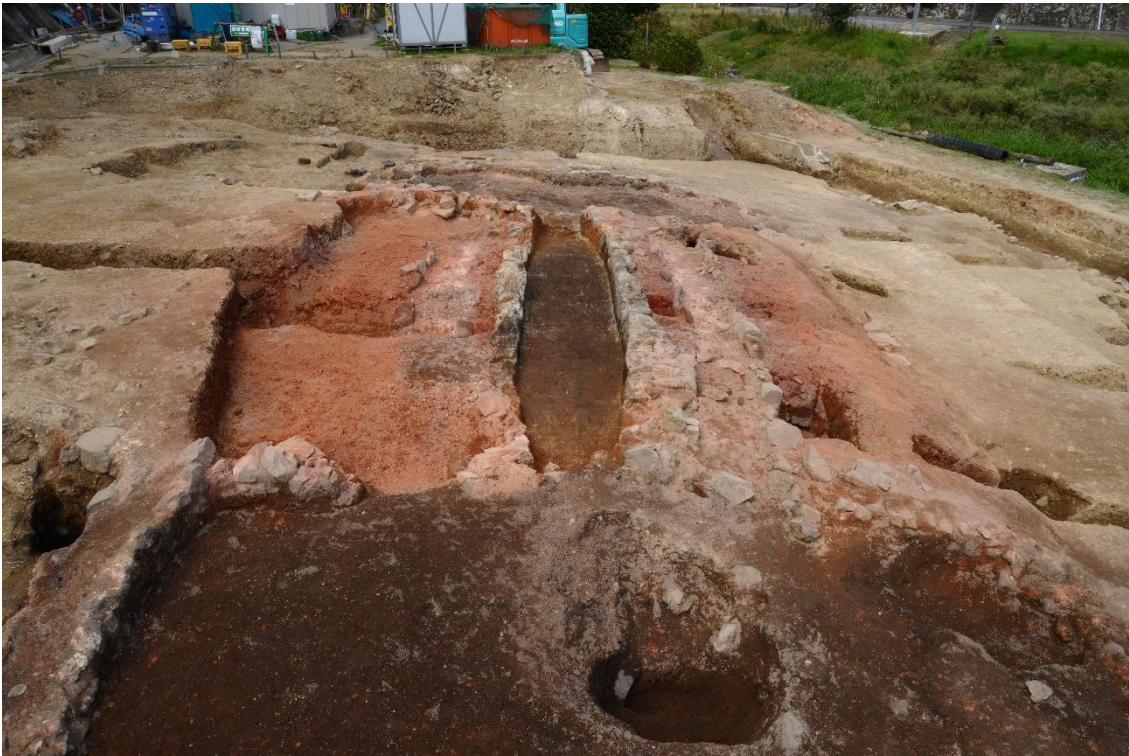
製鉄炉の地下構造（中央が本床）