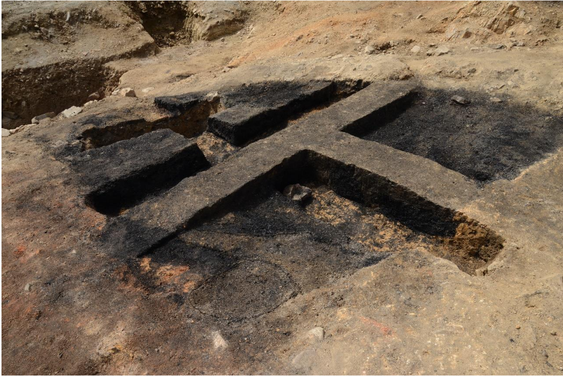
炭町（南）（炭置き場跡）