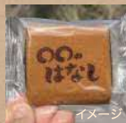
特製オリジナル焼印入り 笑小巻（源氏巻）