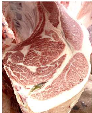
安福久-平茂勝-福栄、去勢 枝重555.6kg、ロース芯 88cm 2 、 BMSNo.12