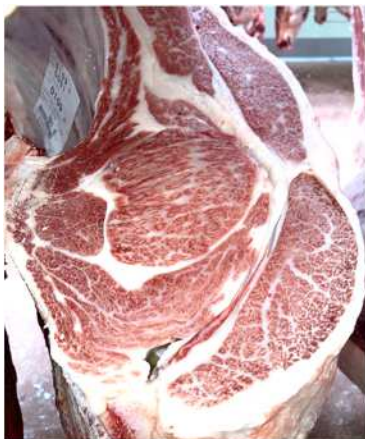
美国桜-美津照重-北茂勝96、去勢 枝重582.8kg、ロース芯 110cm 2 、 BMSNo.12