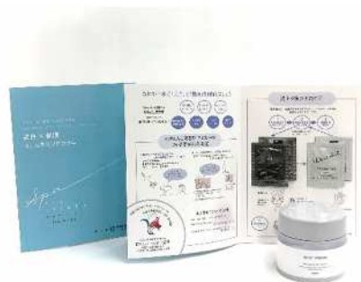
なにわ一水 美肌ウェルネス体験プログラムのキット (イメージ)

本取り組みは、ポーラ・オルビスホールディングスによる各温泉宿に合わせた入浴法やスキンケア化粧品での肌ケアを体験いただける宿独自のプログラム提供※2の一環であり、「はたご小田温泉」に続く2件目として、2024年4月1日から「なにわ一水」にて提供を開始します。報道関係者の方を対象として、なにわ一水での美肌ウェルネス体験プログラムの説明会を開催します。