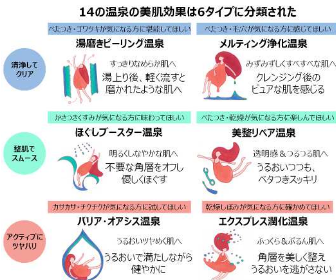
図1. 温泉の美肌効果の分類

https://ir.po-holdings.co.jp/news/news/news/5076556182779435863/main/0/link/20220617_POHD_onsen%20bihada_shimane.pdf