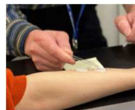
図 3. 温泉水を含ませたろ紙を腕に置く様子

皮脂成分の一つであるオレイン酸を付着させろ紙を 41℃の温泉水または精製水に 16~18 時間浸し、その後ろ紙に残った油分を染色・観察しました。不要な皮脂は肌トラブルの原因となるため、適切に取り除く必要があります。