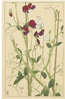
杉浦非水 《じゃかうれんりそう》 『非水百花譜』より 大正9-11年(1920-1922)