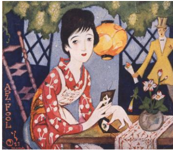
竹久夢二 雑誌『婦人グラフ』第3巻第4号表紙 第3巻第4号表紙(部分) 昭和元年(1926)