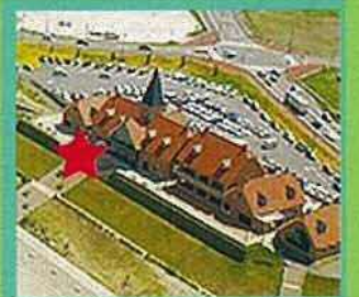
道の駅キララ多伎 海側テラス

10月は移植医療普及推進月間です。 臓器を提供する。移植を受ける。 私たちはどちらの立場にもなる可能性 があります。 この機会と一緒に考えてみませんか？