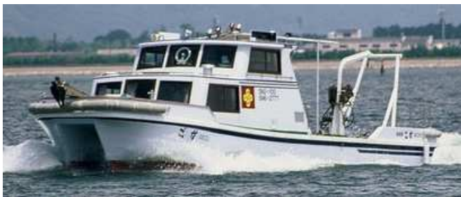
図1 水産技術センター試験船「ごず」による調査