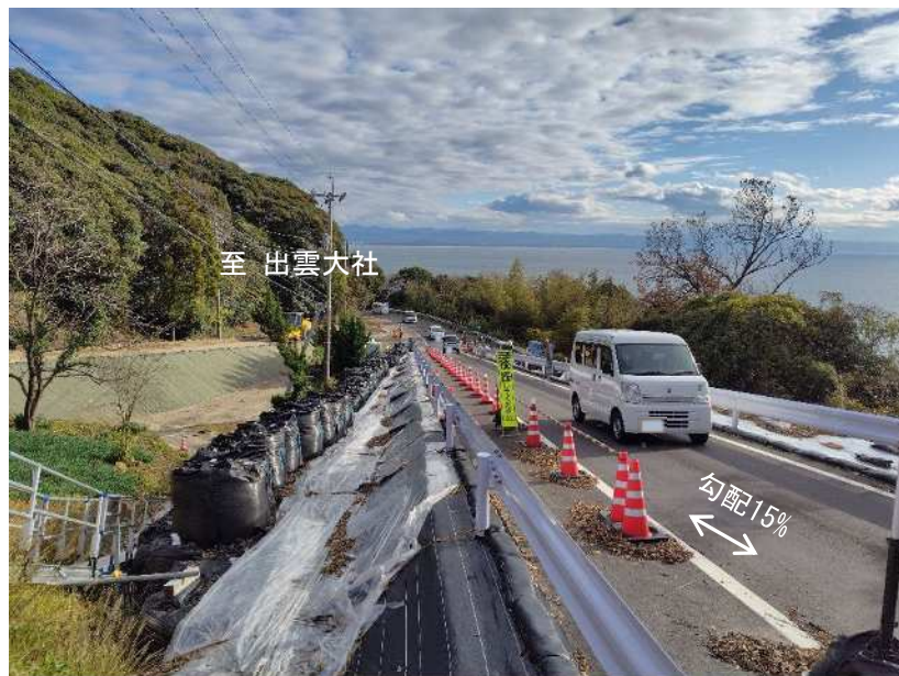
現在の仮設迂回道路の状況写真