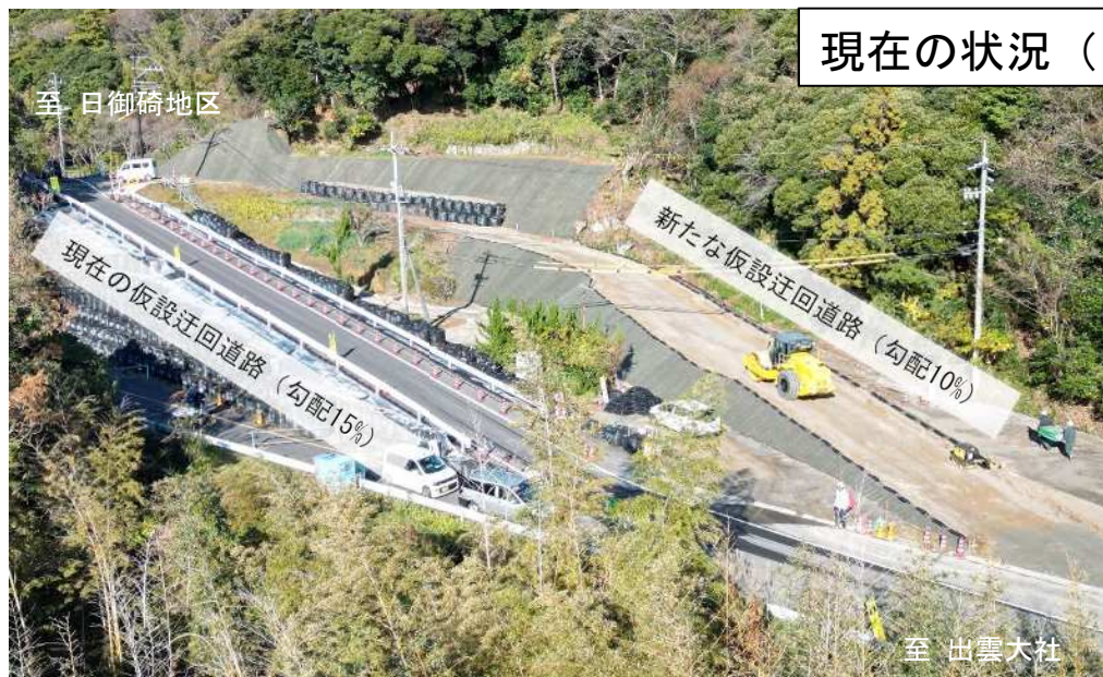
新たな仮設迂回道路の状況写真