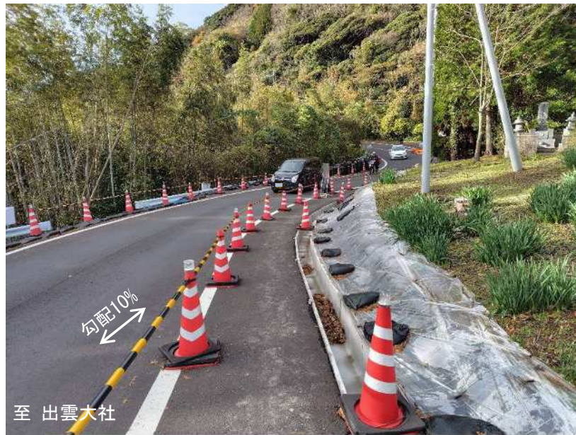
現在の仮設迂回道路の状況写真