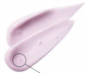
アーモンドオイルを 内包したカプセル

シंकエキスや、アーモンドオイルを内包したカプセルを密着クリームに閉じ込め、 毛穴※に絡みとどまるテクスチャーで 頭皮・髪の汚れを落とし、すこやかに保ちます。