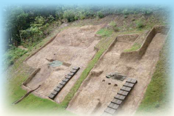
荒神谷遺跡(復元整備後)