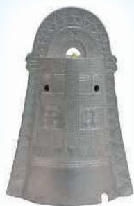
加茂岩倉遺跡出土銅鐸(ミニチュア)