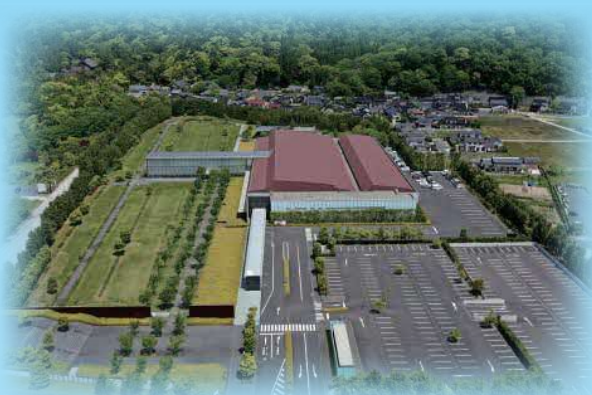
古代出雲歴史博物館とその周辺