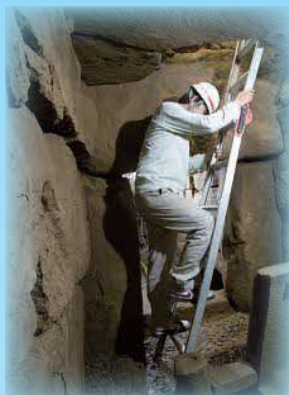
国富中村古墳(梯子を使って石室内へ)