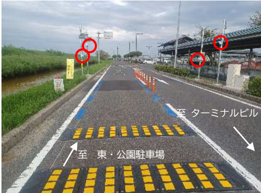
東・公園駐車場一帯管理