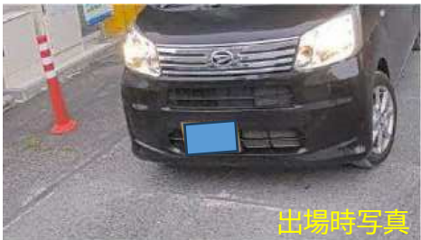
【ナンバー認識カメラ設置箇所】