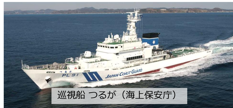
巡視船 つるが（海上保安庁）