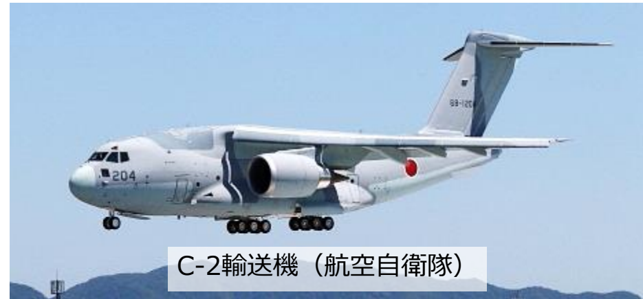
C-2輸送機 (航空自衛隊)