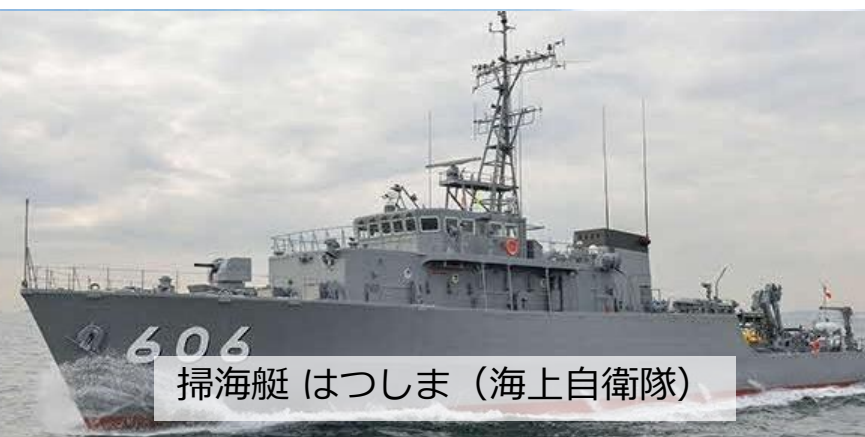
掃海艇 はつしま（海上自衛隊）