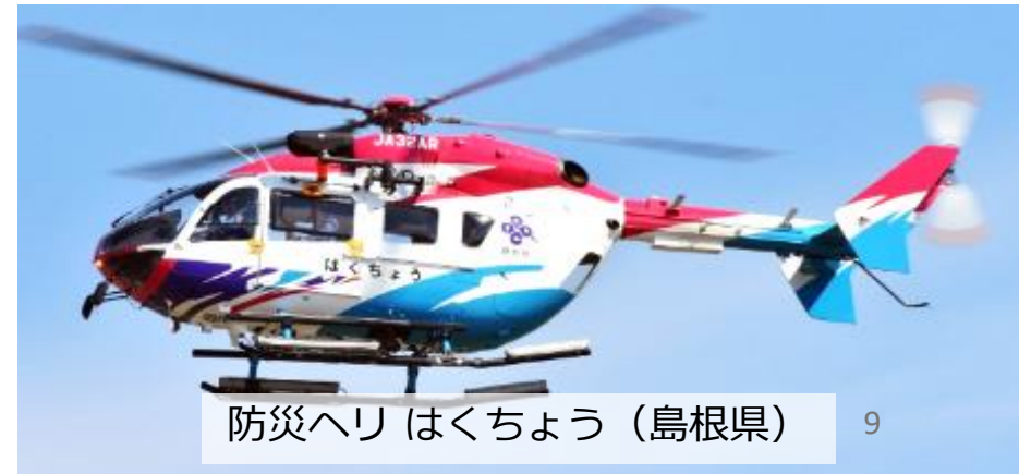
防災ヘリ はくちょう (島根県)