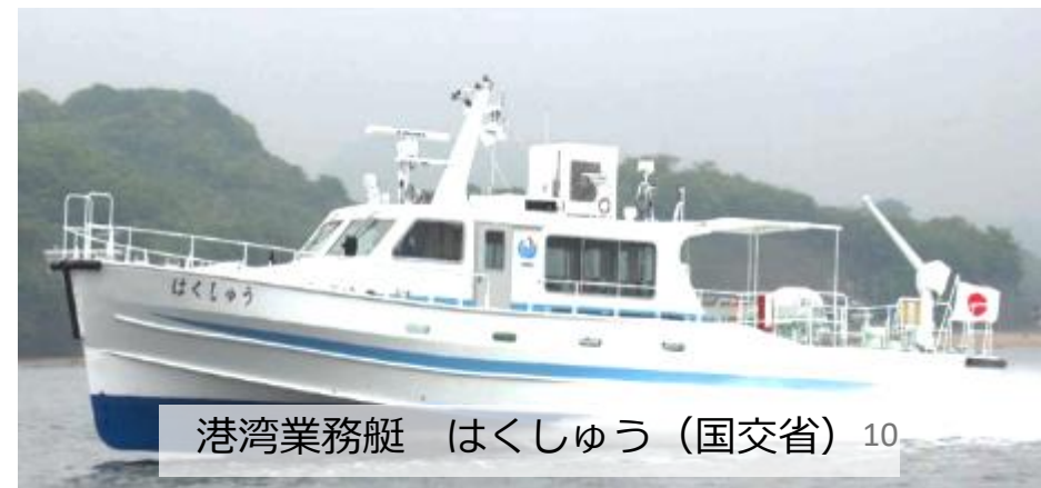
港湾業務艇 はくしゅう（国交省）