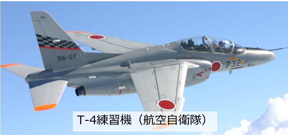
T-4練習機 (航空自衛隊)