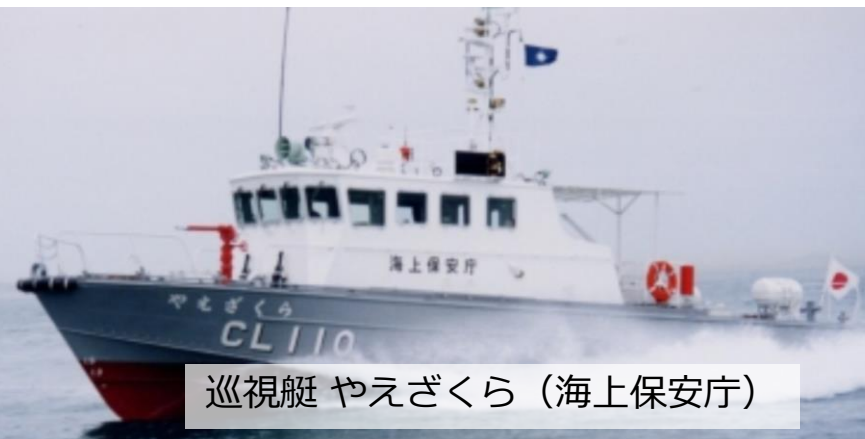
巡視艇 やえざくら（海上保安庁）