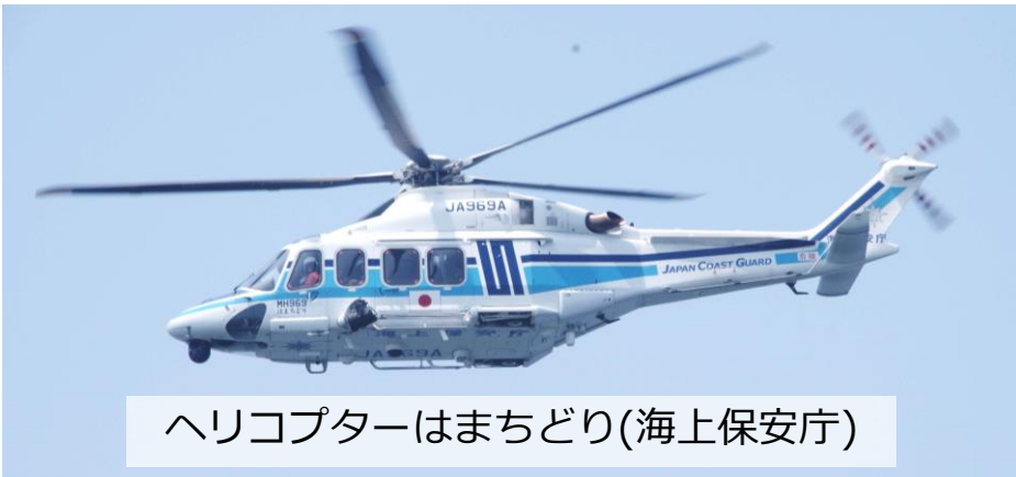
ヘリコプターはまちどり(海上保安庁)