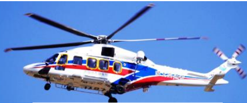
災害対策用ヘリ おりづる（国交省）