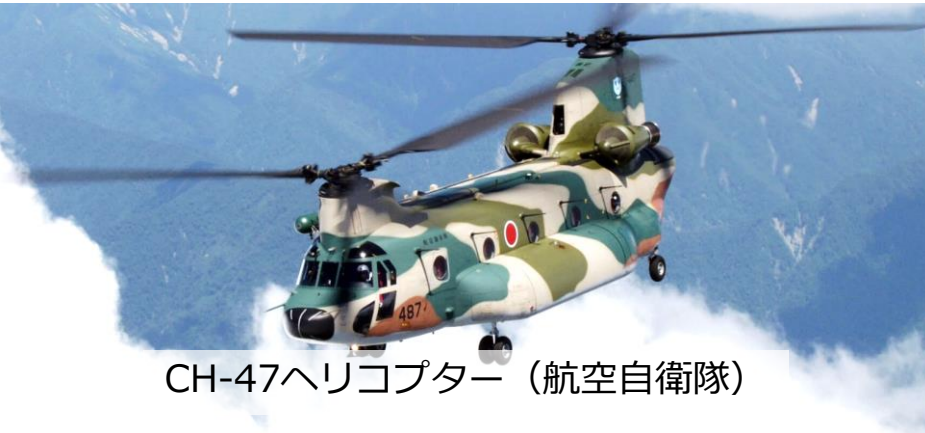
CH-47ヘリコプター (航空自衛隊)