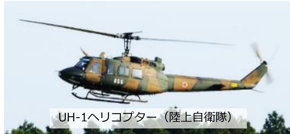
UH-1ヘリコプター (陸上自衛隊)