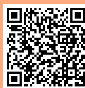
しまね電子申請サービス