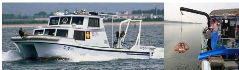
図 1 水産技術センター試験船「ごず」による調査

殻長 12 mm 以上 17 mm 未満の小型成貝についても、本年春季の過去最低水準から大きく増加、殻長 12mm 未満の稚貝も増加しており、中・長期的にも期待が持てる状況です（図 2）。