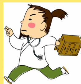
島根県医師募集 キャラクター 赤ひげ先生