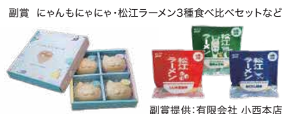
副賞提供: 有限会社 小西本店

最優秀賞 1チーム(3,000円のQUOカード+副賞×人数分) 優秀賞 1チーム(2,000円のQUOカード+副賞×人数分) 審査員特別賞 1チーム(1,500円のQUOカード+副賞×人数分) 優良賞 2チーム(1,000円のQUOカード+副賞×人数分)