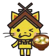
島根県観光キャラクター 「しまねっこ」 島観連許諾第8787号