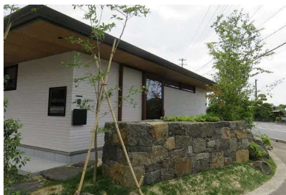
松山市福角の庭 玄関側の石積み