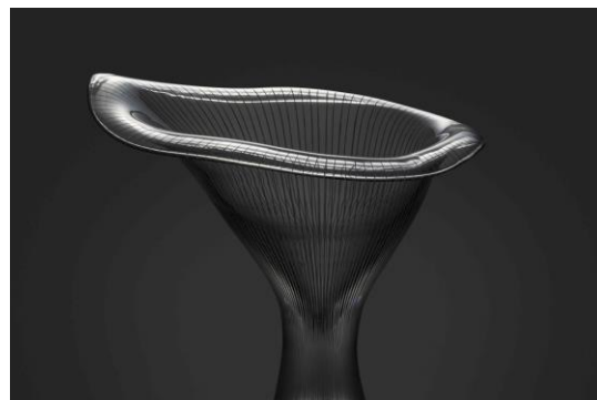
タピオ・ヴィルカラ 《カンタレリ/アンズダケ》

Tapio Wirkkala Rut Bryk Foundation Collection / EMMA —Espoo Museum of Modern Art. © Archivio Venini ©KUVASTO, Helsinki & JASPAR, Tokyo, 2024 C4780