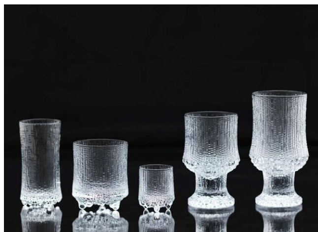
タピオ・ヴィルカラ《ウルティマ・ツーレ（ドリンクング・グラスのセット）》1968年 Tapio Wirkkala Rut Bryk Foundation Collection / EMMA - Espoo Museum of Modern Art. ©KUVASTO, Helsinki & JASPAR, Tokyo, 2024 C4780

©Maaria Wirkkala. Tapio Wirkkala Rut Bryk Foundation Collection / EMMA -Espoo Museum of Modern Art ©KUVASTO, Helsinki & JASPAR, Tokyo, 2024 C4780