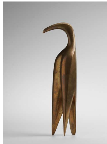
タピオ・ヴィルカラ 《リントウ / 鳥》