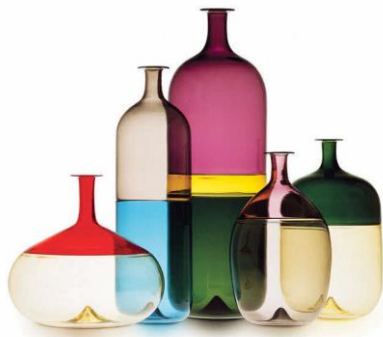
タピオ・ヴィルカラ 《ポツレ》 1966～1967年

※身体障害者手帳(障害者手帳アプリ：ミライロID)、療育手帳、精神障害者保健福祉手帳、 被爆者健康手帳をお持ちの方、およびその付添の方は1名まで無料