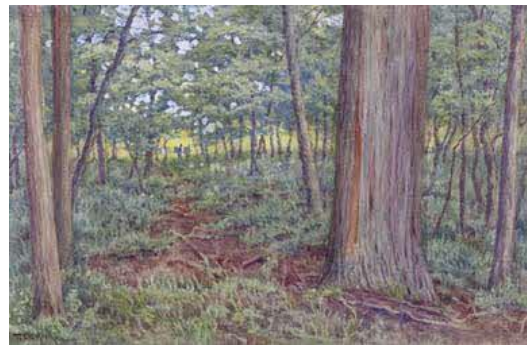
(左) 大下藤次郎《白丸》 1896年 水彩・紙 島根県立石見美術館蔵 (右) 大下藤次郎《林間》 1904年 水彩・紙 島根県立石見美術館蔵